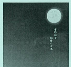
他 「宇野功芳 抒情の世界」CD 指揮: 宇野 功芳 合唱: 神戸市混声合唱団