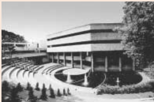
大阪芸術大学 大阪府南河内郡河南町東山