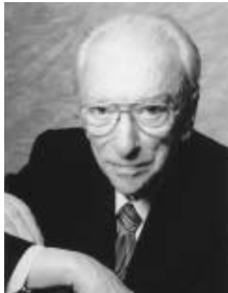
指揮 ゲルハルト・ボッセ