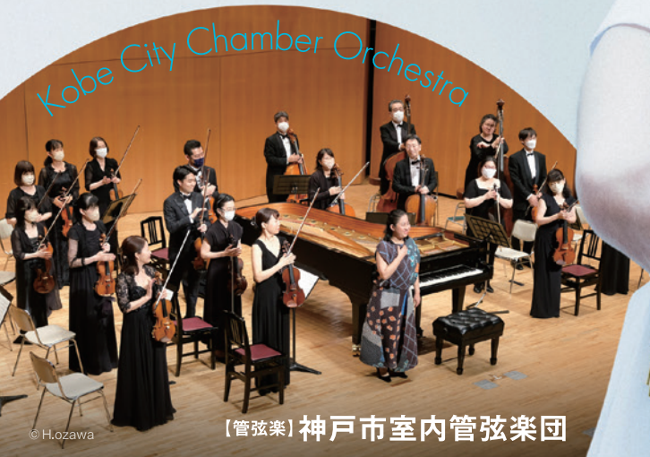
【管弦楽】神戸市室内管弦楽団

Mozart : Konzert Nr.25 für Klavier und Orchester