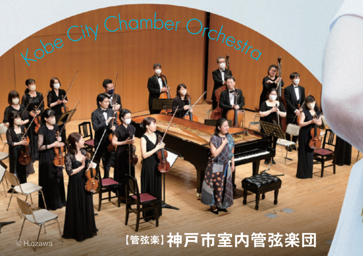
【管弦楽】神戸市室内管弦楽団

Mozart : Konzert Nr.25 für Klavier und Orchester